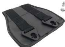
Pasador de velcro 258302-001