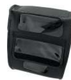
Protector de carcasa IP-54 (Caídas de hasta 1,8 m) 258152-001