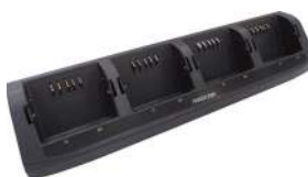
Cargador externo de baterías cuádruple de cuatro ranuras* 258234-001 Américas 258234-002 Europa 258234-003 Reino Unido