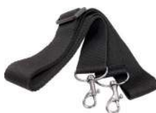
Correa para el hombro 258239-001