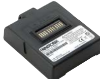
Batería de iones de litio 258235-001