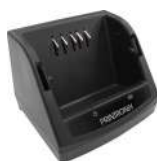
Cargador externo de baterías de ranura única* 258314-001 Américas 258314-002 Europa 258314-003 Reino Unido