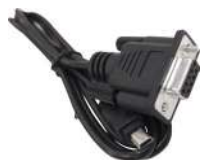
Adaptador USB a RS232 258238-001