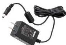
Cargador unitario CA* 258233-001 Américas 258233-002 Europa 258233-003 Reino Unido