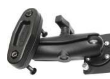
Adaptador para montacargas 258290-001