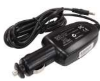
Adaptador de corriente del vehículo 258240-001