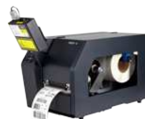
Online Data Validator (ODV)